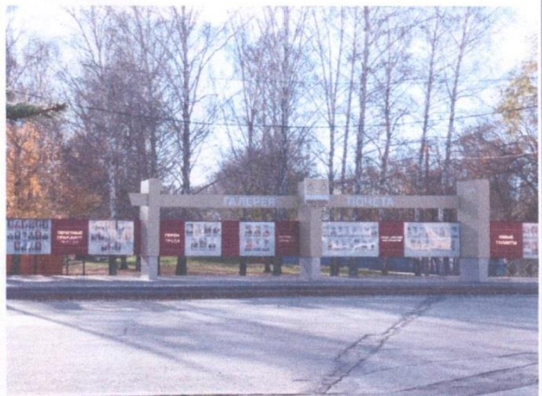
Городская Галерея почёта