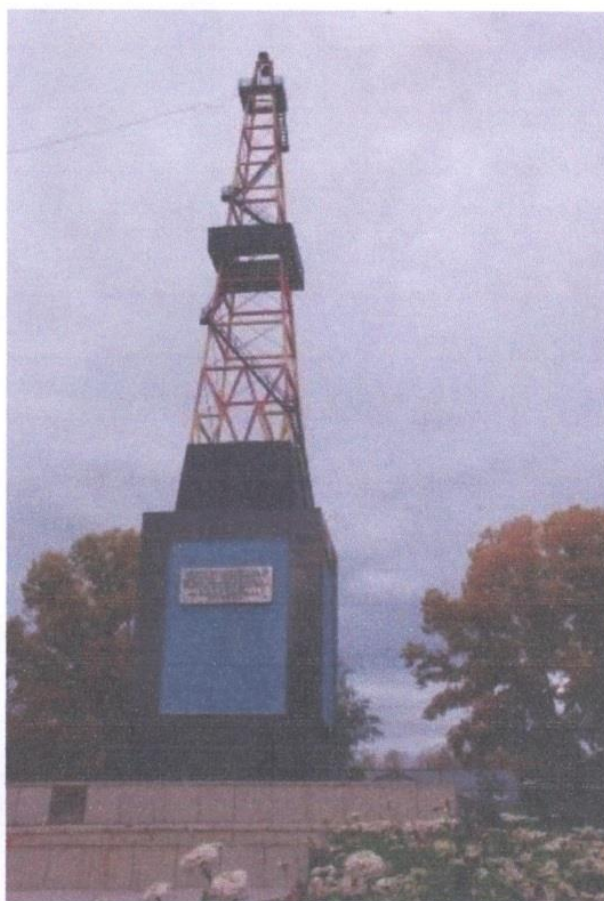
Памятник первооткрывателям мухановской нефти