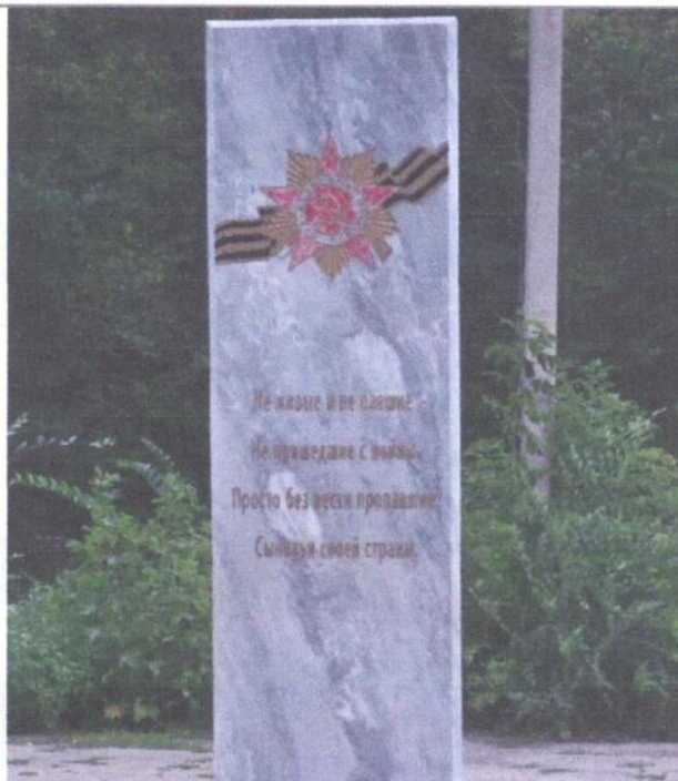
Обелиск в честь солдат и офицеров Красной армии, пропавших без вести на фронтах Великой Отечественной войны