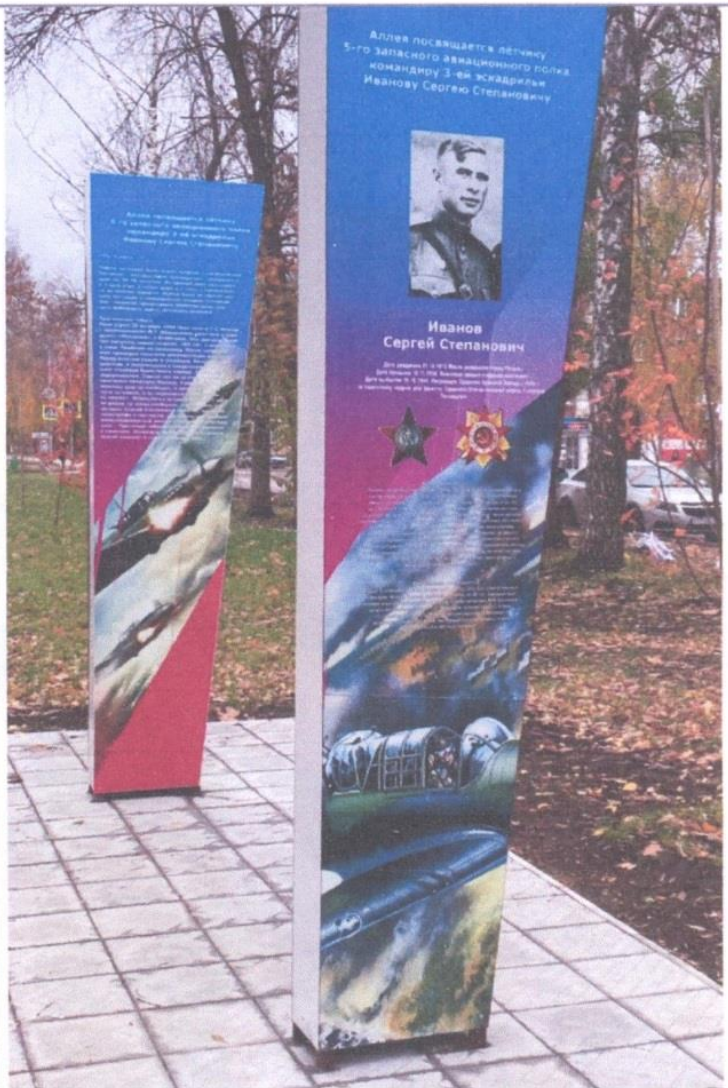
Рябиновая аллея памяти летчика С.С. Иванова