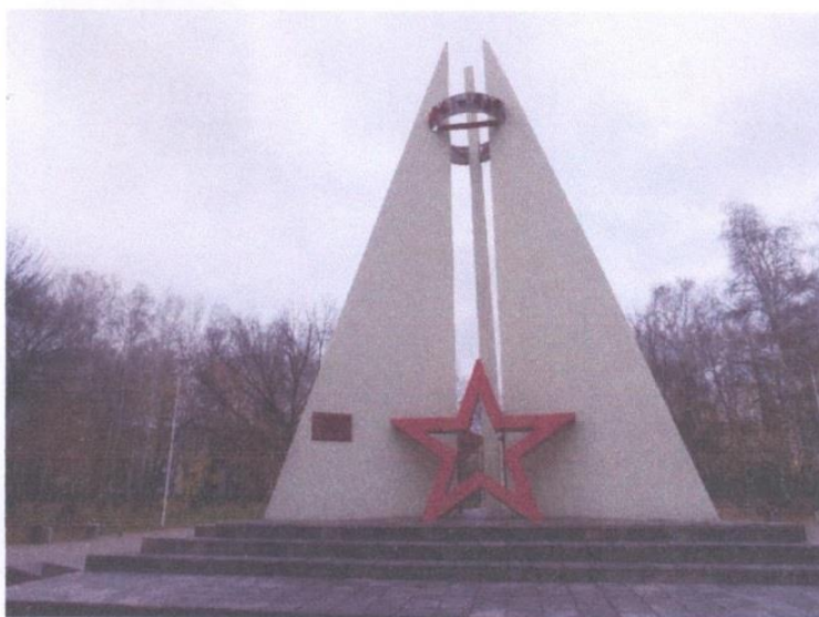
Стела "Фронтовые письма"