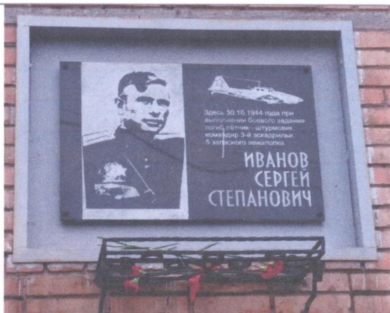
Мемориальная доска памяти С. С. Иванова