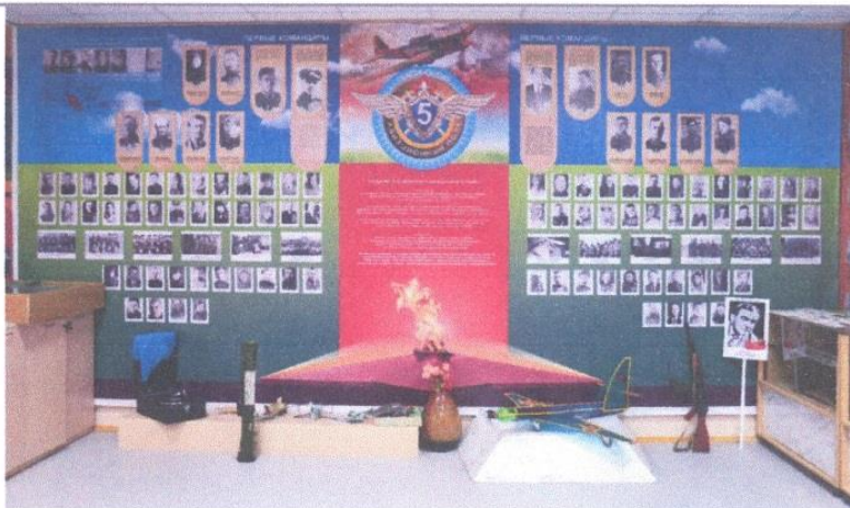
Экспозиция « 5 запасной авиационный полк» 53.380300, 51.346699