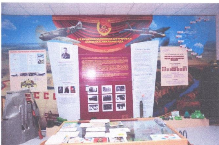
Экспозиция « 1-я Краснознамённая штурмовая запасная авиабригада» 53.380300, 51.346699