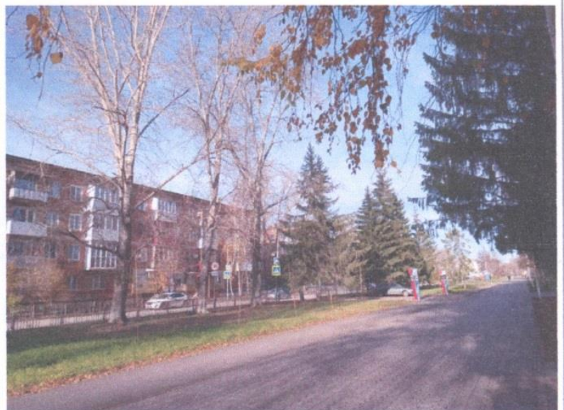
Аллея ветеранов 53АПа