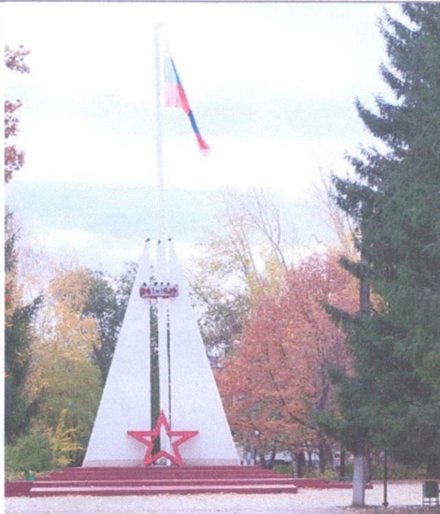
Первый флагшток в честь 75-летия Великой Победы